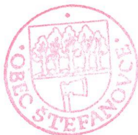
Slavomír Bujko Starosta obce Štefanovce